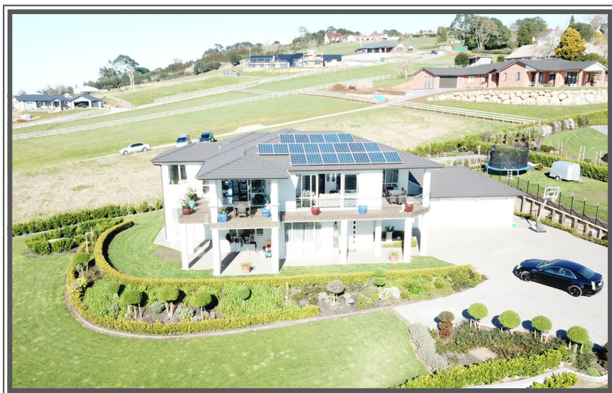
ਹੁਣ ਅਵਤਾਰ ਤਰਕਸ਼ੀਲ ਦਾ ਘਰ